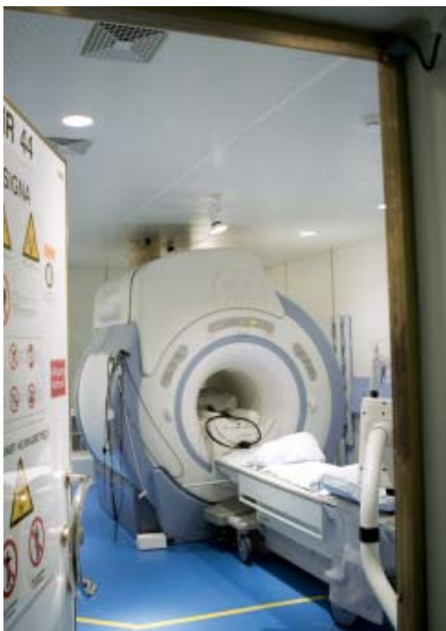
MR-skannere bruges mest til kræftpatienter.