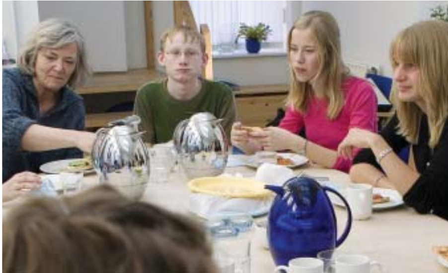
UngeForum slutter hver gang med pizza og hyggesnak.