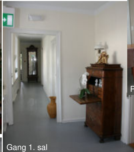
Gang 1. sal