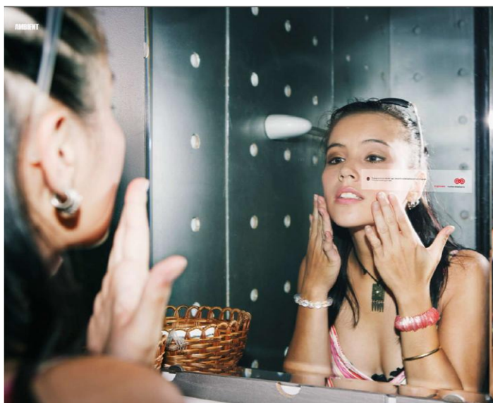
Klistermærket på spejlet findes i solariestandspakken

Solariestanden skal primært henvende sig til forældre med unge i alderen 15-25 år, da det er Solkampagnens målgruppe for solariestandene. Op mod halvdelen af alle unge der går i solarium, og jo tidligere de unge starter, jo farligere er det. Derfor er det vigtigt at informere de unge om risikoen ved brug af solarium, og oplyse forældrene om, hvordan de kan videregive gode solarievaner til deres børn.