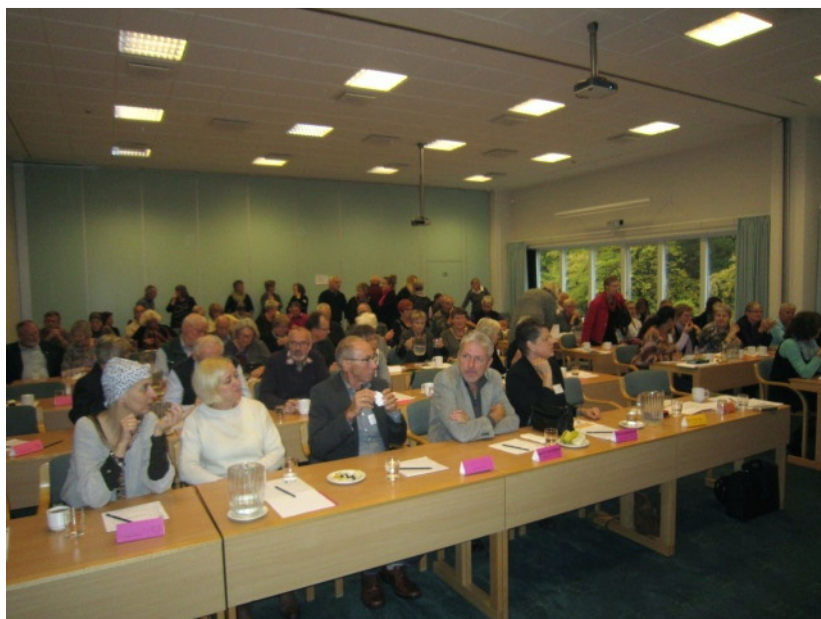
100 personer havde tilmeldt sig konferencen i Randers den 28/10 2011