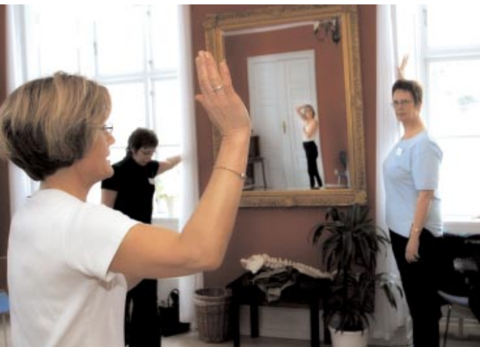
På Dallund bruger man bl.a. styrkøvelser til at få kroppen i gang.